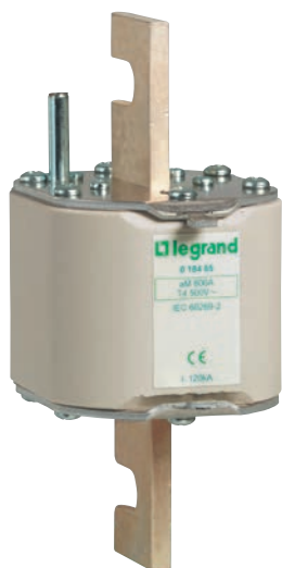
0 184 85